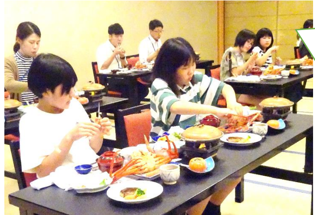
夕食 カニと格闘中