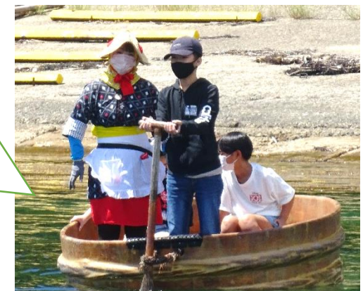
たらい舟を体験中