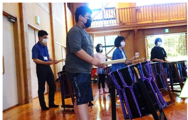
和太鼓 気持ちを一つに