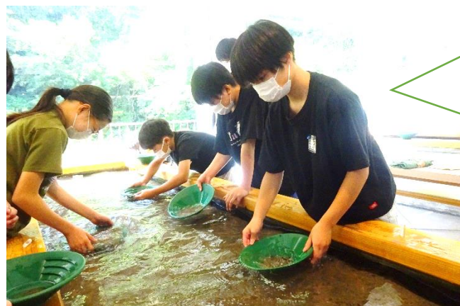
砂金ゲットできるかな？