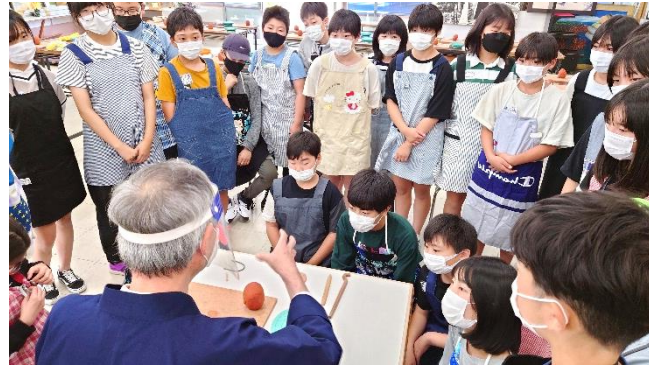
手びねりで形を成型中

6月8日（水）～9日（木）、6年生が1泊2日の修学旅行に行ってきました。朝は雨模様でしたが、フェリーに乗船後は、天候にも恵まれ、全ての活動を気持ちよく進めることができました。修学旅行中に友だちのよさを新たに探すことができた子どもたちが多かったようです。また、協力して素早く団体行動することの大切さも学びました。